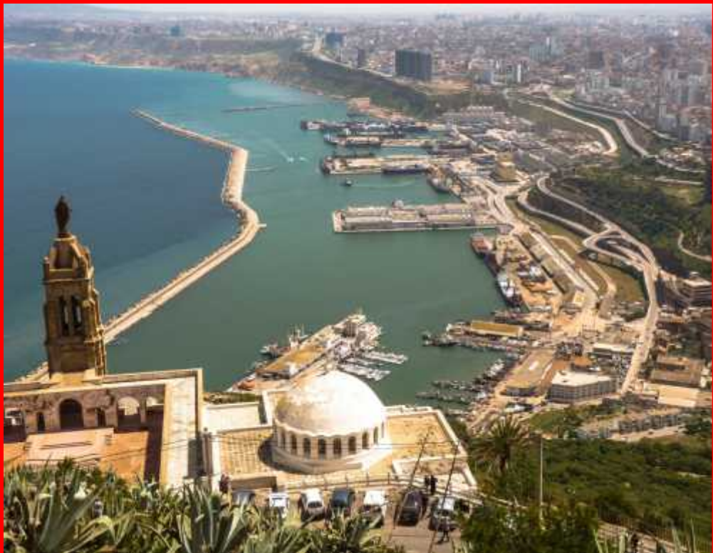
وهران يا بوياء وهران