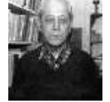
: ديب تاريخ الميلاد: 1920/07/21 تاريخ الوفاة: 2003/05/02