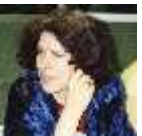
: زهراء*اسيا جبار** المحايين تاريخ الميلاد: 1936 30 تاريخ الوفاة: 06 فيفري 2015