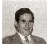
: : تاريخ الميلاد: 1924/12/24 تاريخ الوفاة: 2002/01/01