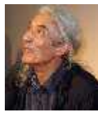
: تاريخ الميلاد: 1949/10/15 بثنية الحد