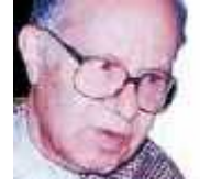
: : تاريخ الميلاد: 1917/03/07 بالمدينة تاريخ الوفاة: 2007/01/13