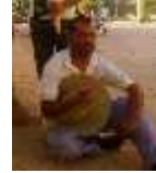
: تاريخ الميلاد: 1970/01/28